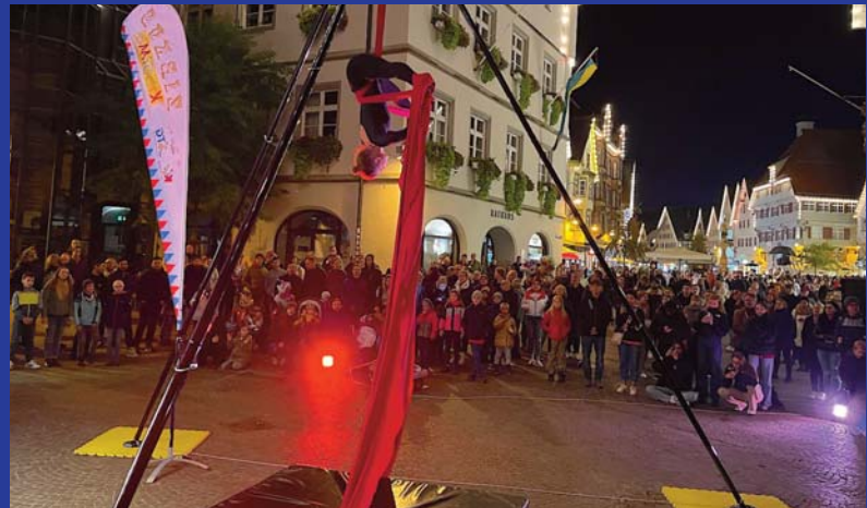
Zirkus KISSIMO - diesmal mit der Akrobatik-Show auf dem Kesselplatz.