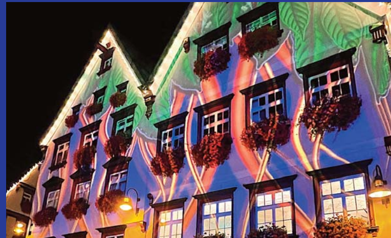
Fantasievolle Illuminationen und coole Autos - vom Autohaus Munding.