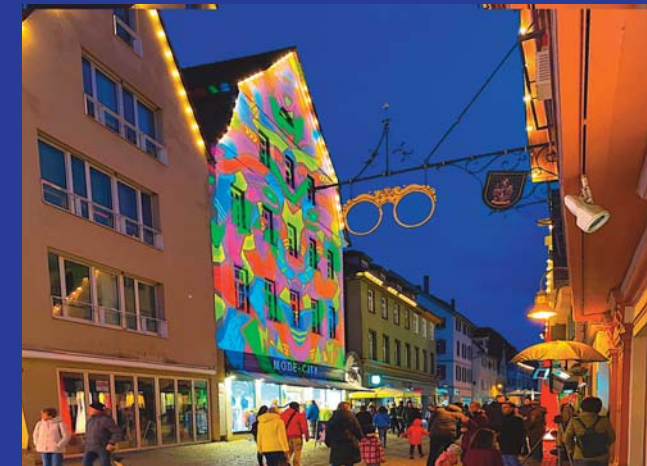
Farbe ist in Mode: Mode-City c/o mit der Bäckerei Eisinger.