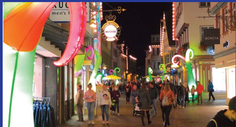
Bunte Leuchtobjekte laden zum farnefrohen Frühlings-Bummel ein.