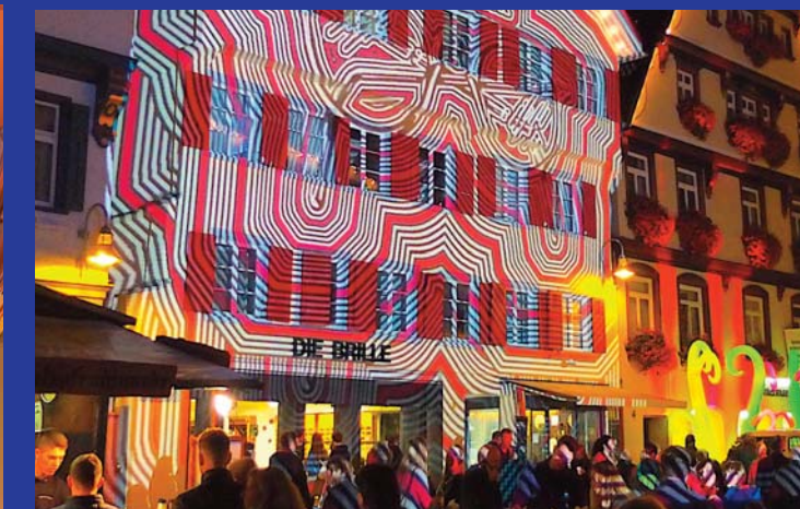
Die Brille bei der Einkaufsnacht - so schön kann Farbe (aus)sehen.